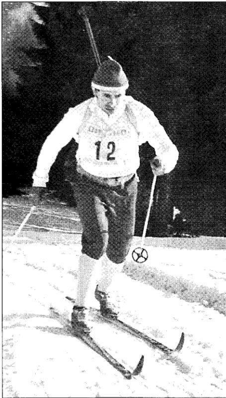
Сорока на трасе Петрозаводска