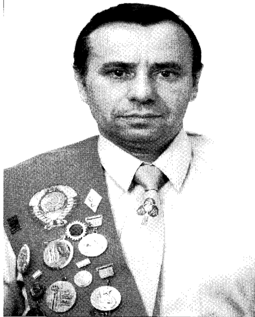
Мастер спорта международного класса Ярослав Сорока

Приємно усвідомлювати, що дідусь сам досягав висот, яких неспроможні досягти навіть спортсмени, з якими працюють визнані тренери.